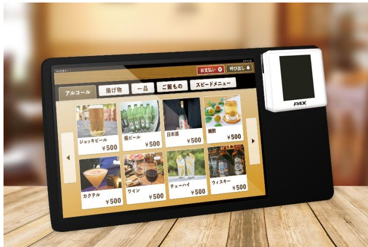
図 2 : SPoC 技術を活用した、小型のセルフ決済端末のイメージ