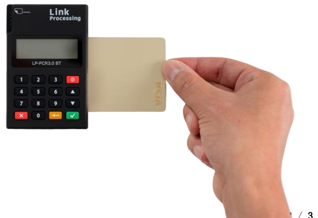
図3: 「Anywhere」の利用イメージ